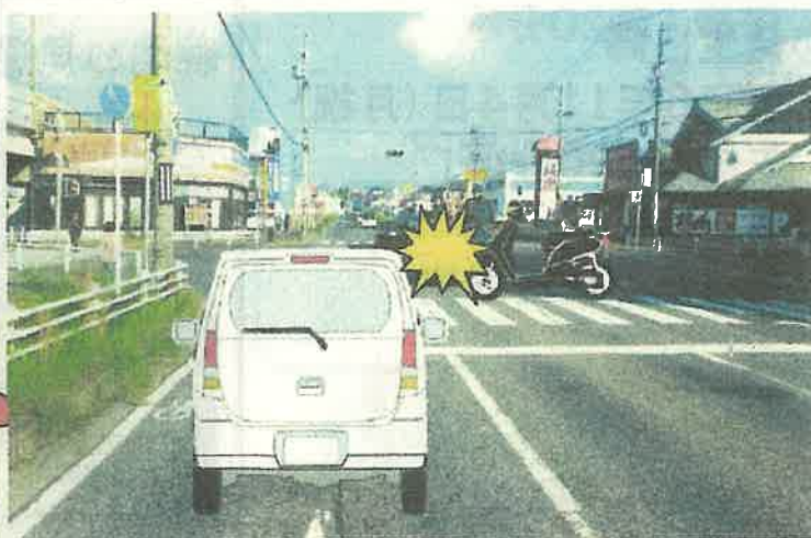
現場の見通し写真